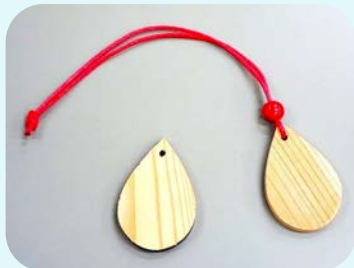
森の雫 (ペンダント)

幼児を対象とした「みやざき木育プログラム (森の雫づくり)」の保育者研修会を行います。