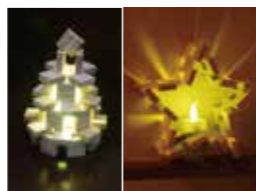
杉のランプシェード 500円(税別)