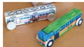
木のくるま 400円(税別)