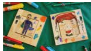
つみきパズル 500円(税別)

講師……………1名 標準的な作成時間……………20分~40分 いずれも簡単な工作作業で完成できます。材料のみの提供も可能です。