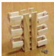
ビー玉コロコロ4段・6段 4段1,000円(税別) 6段1,200円(税別)